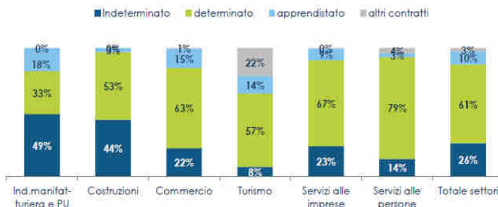
Graf. 3a - Provincia di Como: entrate per settore di attività e tipologia contrattuale

A Como , la maggioranza dei nuovi ingressi a tempo indeterminato previsti si concentra nel manifatturiero e nelle costruzioni (rispettivamente 49% e 44%); viceversa, il terziario vede una netta prevalenza di contratti a tempo determinato (nei servizi alle persone il 79%; nei servizi alle imprese il 67%; nel commercio il 63%; nel turismo il 57%). Anche a Lecco , prevalgono gli ingressi a tempo indeterminato nelle costruzioni (71%) e nel manifatturiero (50%); il tempo determinato è maggiormente utilizzato nei servizi alle persone (57%) e nel commercio (51%). Nel turismo si nota un alto ricorso ad altre tipologie di contratti, a cui afferisce il 45% delle assunzioni previste.