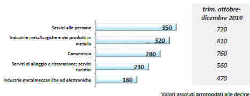
Graf. 1 - Provincia di Lecco: entrate previste nel mese di ottobre e nel 4° trimestre 2019 nei principali settori

I valori assoluti sono arrotondati alle decine. A causa di questi arrotondamenti la somma dei singoli settori può non coincidere con il totale