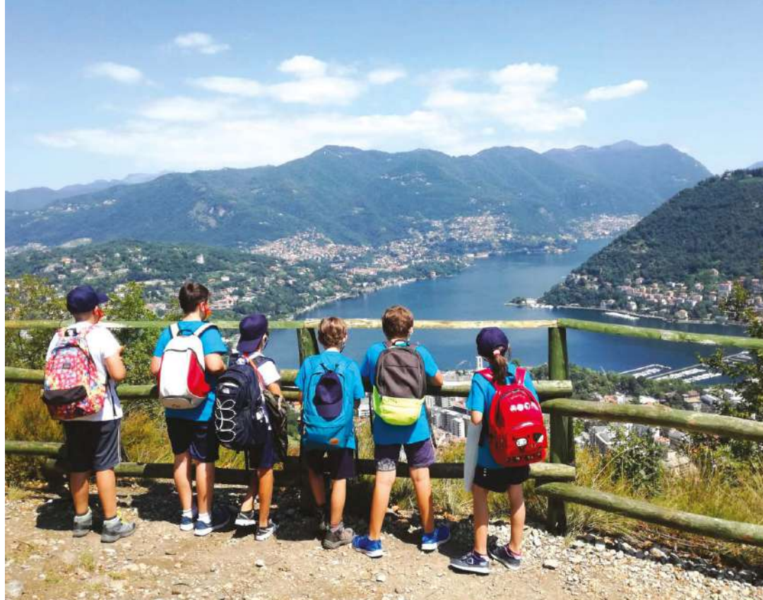
Foto grande Parco della Spina Verde