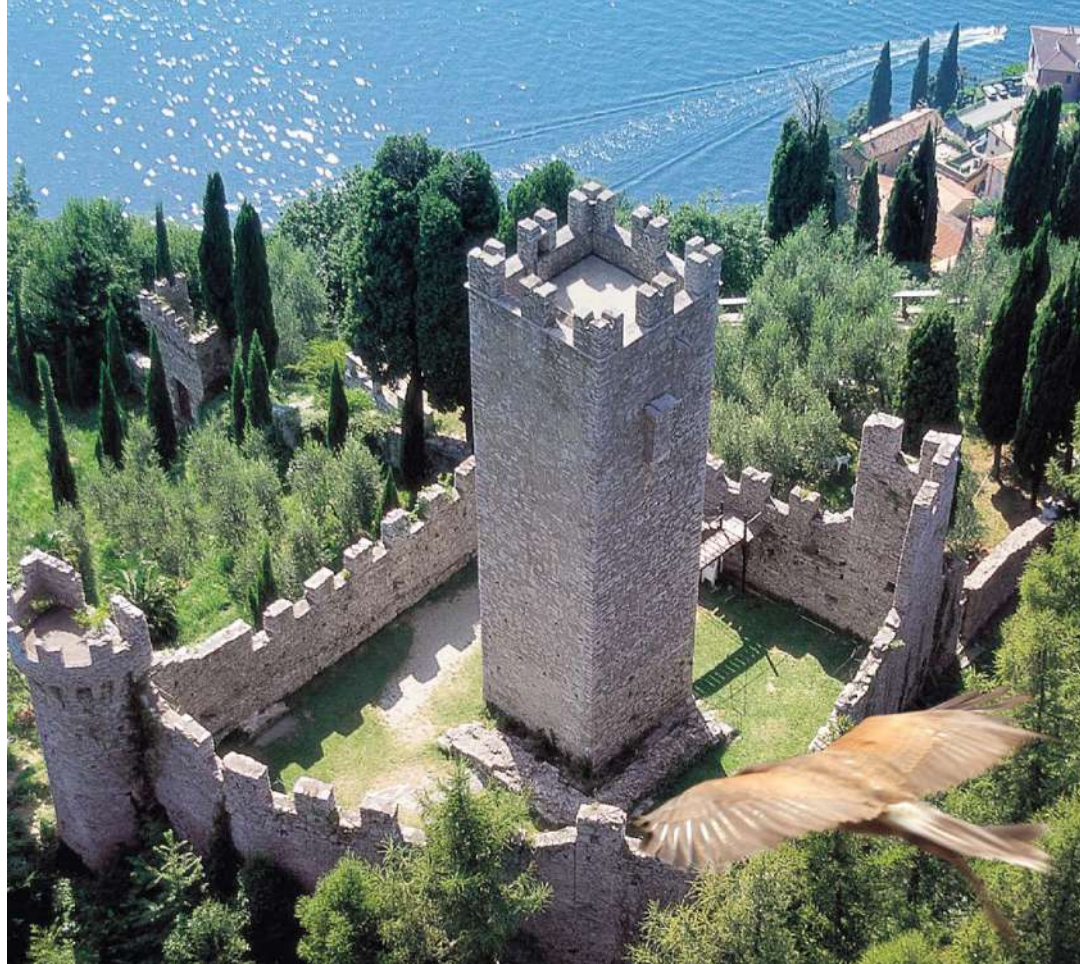
Foto grande Castello di Vezio