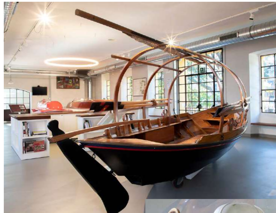
Museo Barca Lariana