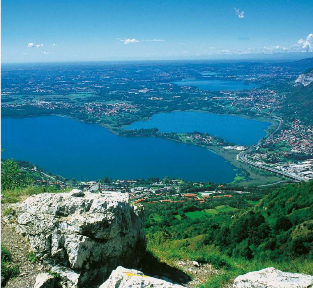
Foto grande I laghi Briantei

Il lago di Pusiano è una zona protetta dove è possibile effettuare escursioni con i battelli elettrici per ammirare da vicino l'isola dei Cipressi, un isolotto privato con un giardino ricco di rare essenze arboree, uccelli e animali esotici. Il piccolo lago è