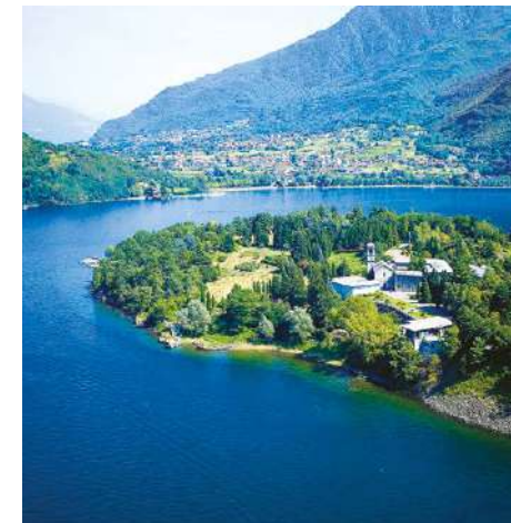
Foto grande Forte Montecchio Nord

Sulla penisola di Olgiasca, di fronte a Gravedona, sorge l'antico Priorato di Piona, un'abbazia benedettina del XII secolo, raro gioiello di architettura romanica lombarda. Il complesso monastico, immerso in un'atmosfera di pace e tranquillità, è costituito dall'austera chiesa di San Nicola, che nella sua semplicità emana la spiritualità tipica delle chiese benedettine medievali e dal suggestivo chiostro, punto di riferimento della vita del monastero. Le 41 colonne che lo compongono sono ornate da capitelli scolpiti con tipiche raffigurazioni e simbologia dello stile romanico. L'abbazia, raggiungibile anche via lago con il battello, è ancora oggi abitata da monaci cistercensi che permettono tutto l'anno la visita di questo luogo di preghiera e gestiscono un piccolo punto vendita di prodotti delle officine del Priorato.