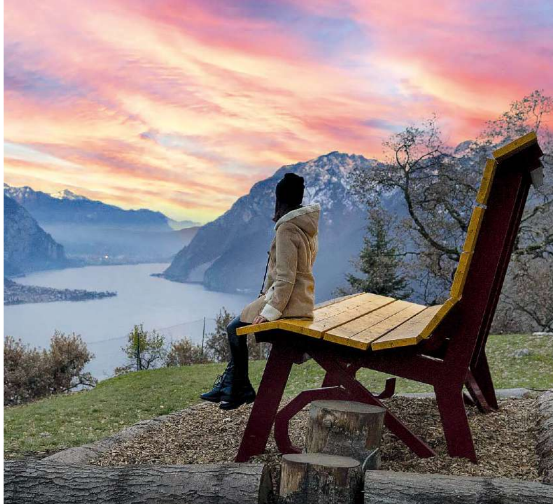
Foto grande Panchina gigante di Civenna

“Per ritornare bambini riscoprendo il paesaggio”