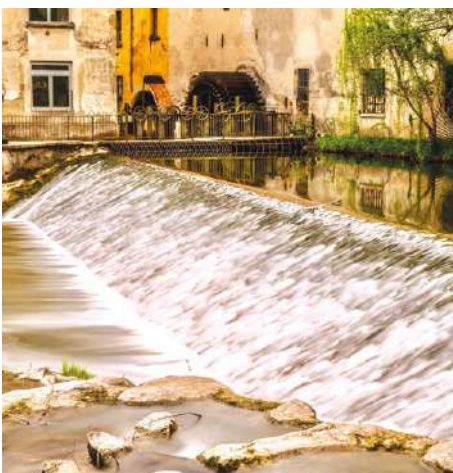
Foto piccola Mulino sul Lambro

anche sede di un prestigioso centro remiero di alta specializzazione dove si allenano gli equipaggi di tutto il mondo.