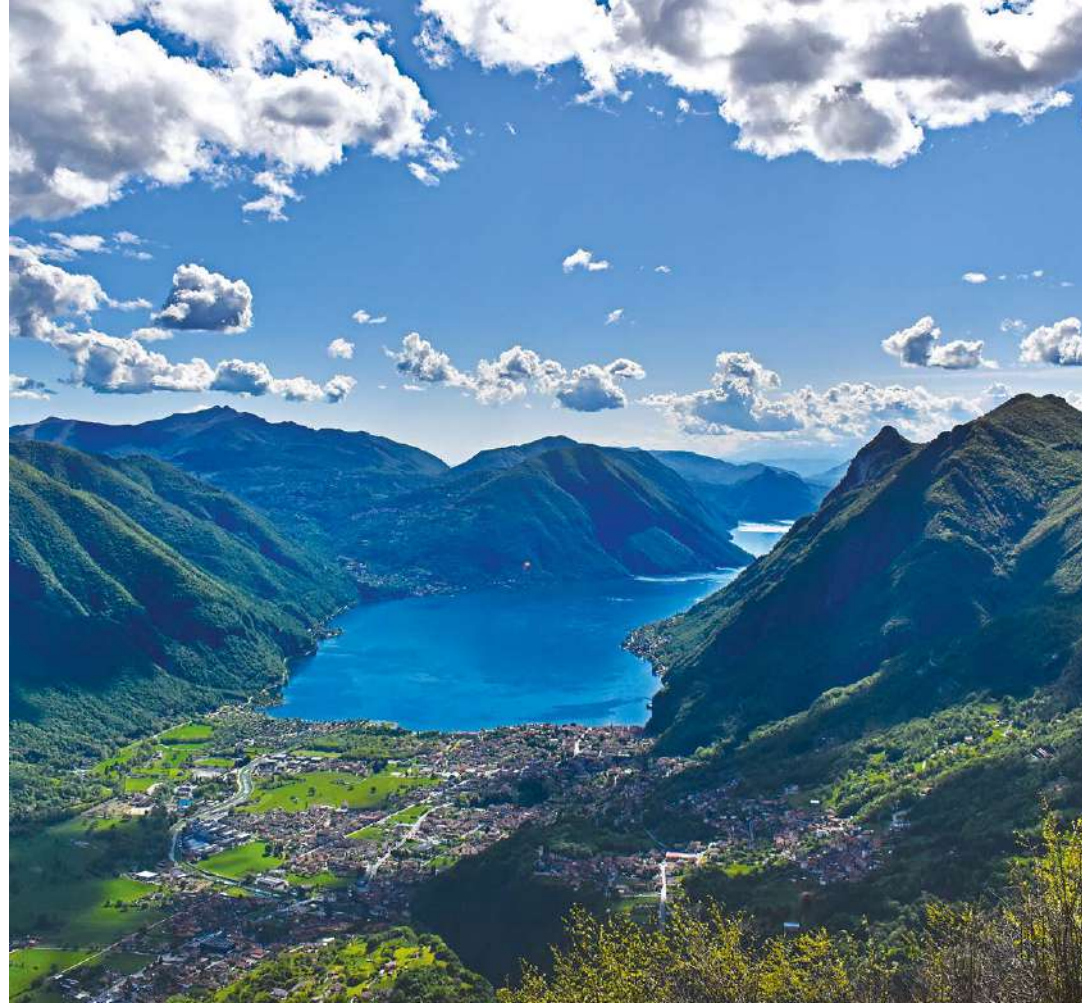
Foto grande Panorama del Ceresio

Il Ceresio, meglio conosciuto come lago di Lugano, è racchiuso tra l'Italia e la Svizzera, sulla punta più meridionale del Canton Ticino. La provincia di Como ne abbraccia un tratto, dalla frontiera di Gandria, a Oria Valsolda, fino alla rinomata cittadina di Porlezza, per giungere poi a Claino con Osteno con le Grotte di Rescia e la frazione alta chiamata il "Borgo Dipinto", dove le case sono decorate da pannelli artistici. Un paesaggio unico tra lago e montagna, con piste ciclabili, piccole spiagge, percorsi di trekking, antiche chiese e borghi che, dalla riva, si arrampicano sui pendii, collegati tra loro con i battelli della Navigazione Lago di Lugano. Un "Piccolo Mondo Antico" come lo raccontò Antonio Fogazzaro nel suo famoso romanzo, le cui atmosfere rivivono a Villa Fogazzaro Roi, a Oria, frazione di Valsolda, dove lo scrittore soggiornò a lungo e che oggi è di proprietà del FAI, Fondo per l'Ambiente Italiano. Sul lago di Lugano, ma completamente circondato da territorio svizzero, il comune di Campione d'Italia è una singolare exclave italiana che fa parte della provincia di Como. Nota soprattutto per il Casinò, la piccola cittadina è ricca di tesori artistici, come la chiesa di Santa Maria dei Ghirli, eredità di quella tradizione di artigiani, scultori, architetti e pittori conosciuta come scuola dei Maestri Campionesi.