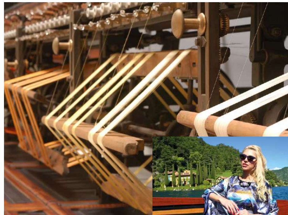
Foto grande Aspatrice @Museo della Seta Foto piccola @archivio Masciadri

Il settore industriale storicamente più radicato nel territorio e nella cultura locale è quello della seta. La storia del filo d'oro ha origini lontane e inizia alla corte imperiale cinese che per secoli ne custodì il segreto. Dopo l'anno mille la lavorazione della seta si diffuse in Italia e nel 1400 arrivò nella zona del Lago di Como dove ebbe grande sviluppo, diventando traino dell'economia locale per molti decenni. Oggi Como, con il suo distretto serico, è ancora considerata la capitale mondiale della seta grazie al tessuto lavorato, vero protagonista del mondo della moda nazionale ed internazionale, che la creatività e la fantasia dei disegnatori comaschi rendono unico.