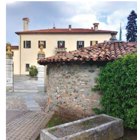
Foto piccola Villa Imbonati, Cavallasca