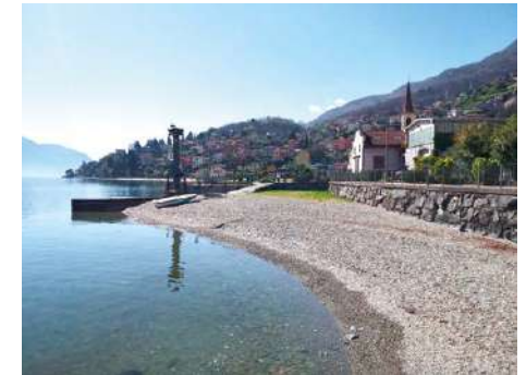
Foto piccola Spiaggia di Pianello Lario

Bellagio: www.lidodibellagio.com Bellano: www.lidobellano.com Brienno Campione d'Italia (lago Ceresio) Careno Cernobbio: www.lidodicernobbio.com Claino con Osteno (lago Ceresio) Colico: www.lidocolico.it e Ontano Dongo Eupilio: (lago del Segrino) www.lidodelsegrino.it Faggeto Lario: www.lidodifaggeto.com Gravedona ed Uniti Griante - Cadenabbia: www.morlakecomo.com Lenno: www.lidodilenno.com Lierna Mandello del Lario: www.lidodimandello.com e Moregallo (sponda opposta) Menaggio Merone: (lago di Pusiano) www.allido.eu Moltrasio Montorfano: (lago di Montorfano) www.lidodimontorfano.it Oliveto Lario Ossuccio: www.lidodiossuccio.it Perledo: www.inrivagittana.com e Malpensata Porlezza: (lago Ceresio) www.panama-beach.it