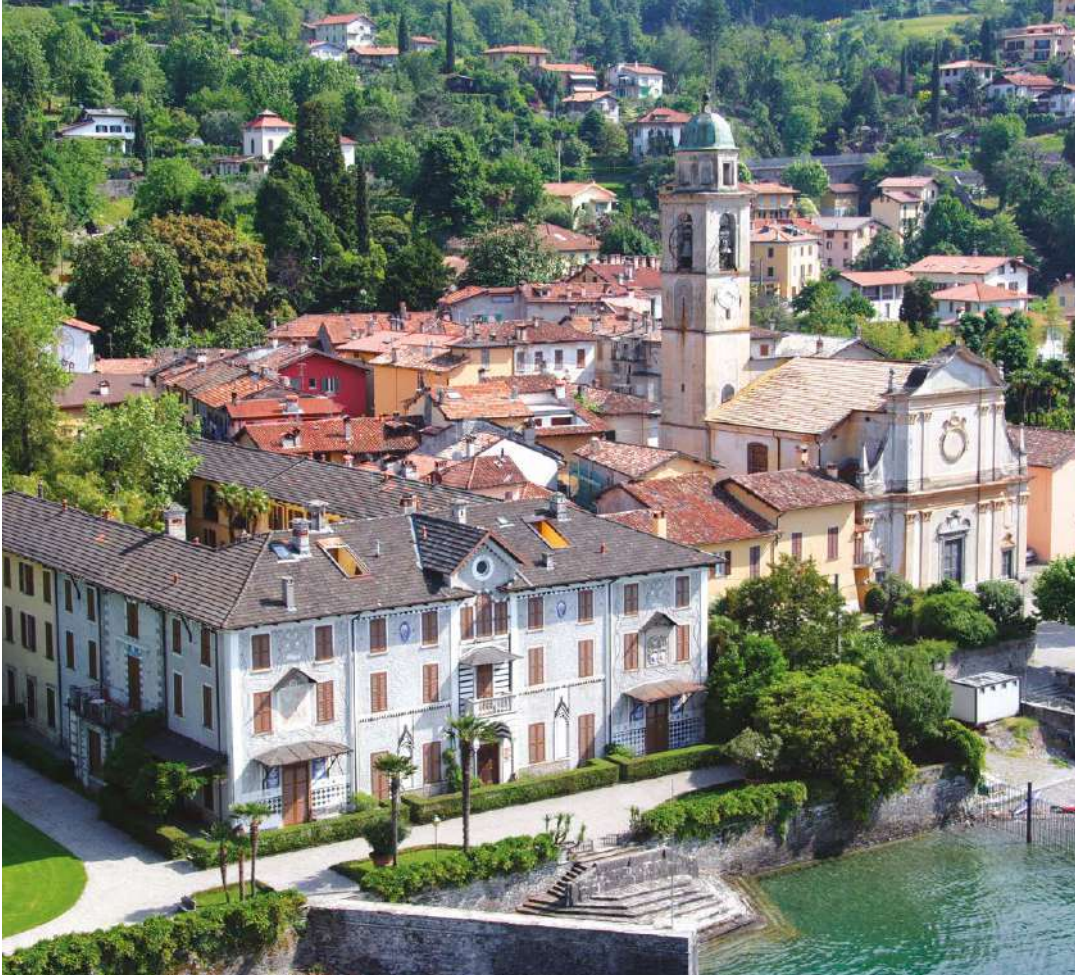
Foto grande San Giovanni, Bellagio